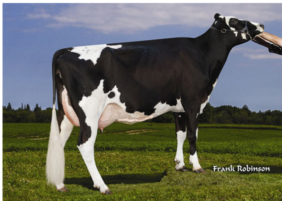
HILMAR LERO 6464