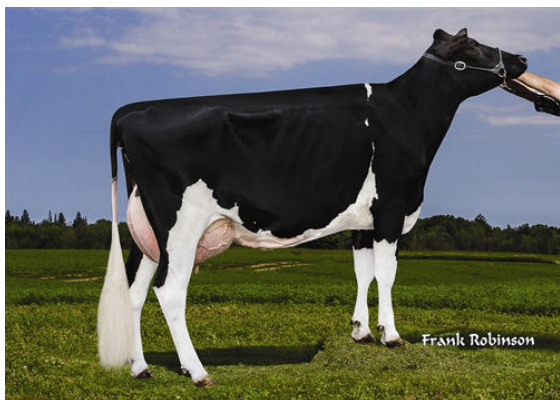
CALORI-D JK LERO ILLIANA